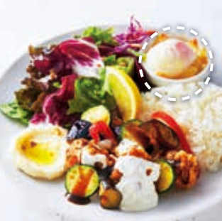
Chicken & Vegetable with Black Vinegar Sauce & Tartar 鶏と野菜の黒酢あん タルタルプレート