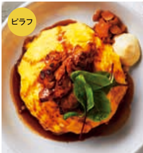
炭焼きチキンの照り焼きソース オムライス +100 [税込110]