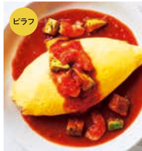
エビとアボカドのトマトソース オムライス +300 [税込330]