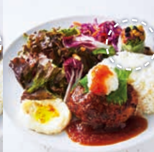
Hamburg Steak with Grated Radish Sauce ハンバーグプレート (和風おろしソース)