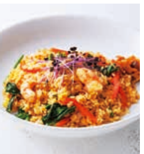
エビとベーコンのバターピラフ