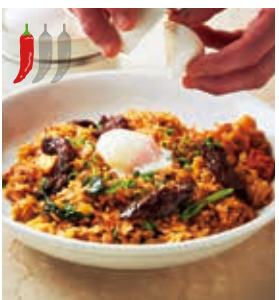
牛ハラミと半熟玉子の コク旨チャーハン +300 [税込330] ※とても辛い生唐辛子添え