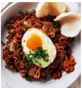
豚肉の黒旨ガーリックチャーハン ※とても辛い生唐辛子添え