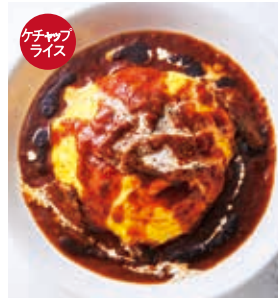
牛肉の煮込みオムライス +500 [税込550]