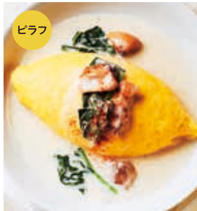
炭焼きチキンとほうれん草の クリームオムライス +100 [税込110]