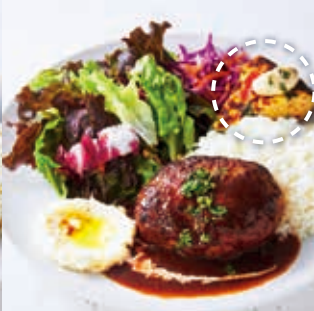
Hamburg Steak with Demi-Glace Sauce ハンバーグプレート (デミグラスソース)