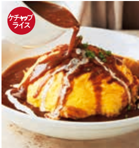
ふわふわ帽子のオムライス