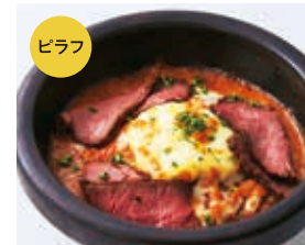
ローストビーフと クリーミートリュフ マッシュポテトの ブラウンソースドリア +300 [税込330]