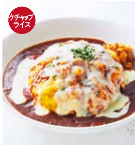
チョモランマオムライス +200 [税込220]