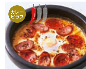
ソーセージとペパロニの キーマカレードリア +100 [税込110]