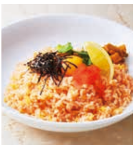
タラコとトピコの バター醤油ピラフ +100 [税込110]