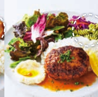
Hamburg Steak with Lemon flavored White Wine Butter Sauce ハンバーグプレート (レモン香る白ワインバターソース)

※消費税の計算上、レジでの精算の際に、合計額が異なる場合がございます。 ※写真はイメージです。