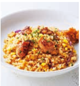
炭焼きチキンの ガーリックバターピラフ