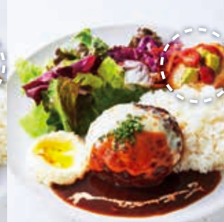
Hamburg Steak with Demi-Glace Sauce & Cheese ハンバーグプレート (デミグラスソース&チーズ) +100 [税込110]