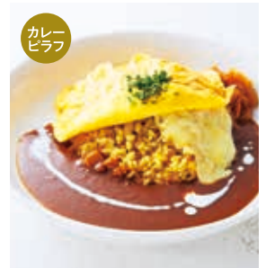
欧風カレーのチーズイン オムライス +100 [税込110]