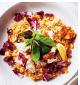
チキン南蛮ピラフ +200 [税込220]