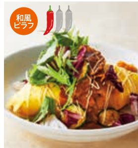
豚肉とズッキーニの 甘辛マヨオムライス +100 [税込110]