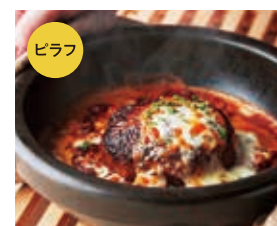
デミグラス ハンバーグドリア +200 [税込220]