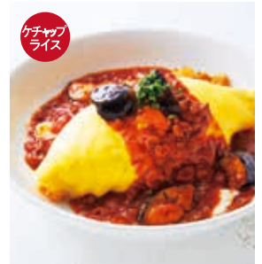
ナスとモッツアレラの ミートオムライス +300 [税込330]