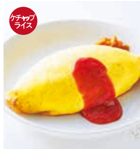
レギュラーオムライス